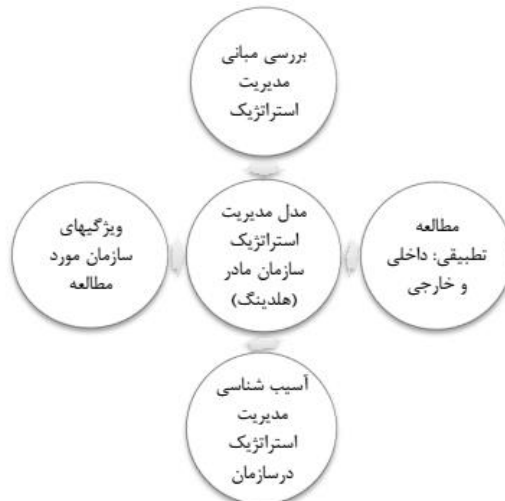
شکل ۱. مراحل اصلی برای طراحی الگو

در این مطالعه به‌جای توجه صرف به الگو و فرآیند برنامه‌ریزی راهبردی، مدیریت راهبردی شامل طراحی الگو، تدوین برنامه، اجرای برنامه و ارزیابی و کنترل برنامه راهبردی مدنظر قرار گرفته است. بدیهی است این رویکرد برگرفته از مبانی، مطالعه تطبیقی و عارضه‌یابی برنامه پنج‌ساله نخست بوده است. شاید به‌ظاهر چنین به نظر برسد که در سازمان‌های دولتی، مدیریت راهبردی کاربردی ندارد؛ ولی عکس داستان صادق است.