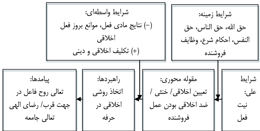
شکل ۲. الگوی حاصل از پژوهش

با توجه به بیانات آقای دکتر مجتبی مصباح: منظور از نتیجه مطلوب، نتیجه‌ای است که بر تعالی روح فاعل اثرگذار باشد. لذا غایت ما یعنی: تعالی روح فاعل در جهت قرب/ رضای الهی جزو پیامدهای این مدل می‌باشد و برای تکمیل این پیامد به محدود بودن تعالی انسان بدون دیگر خواهی و توجه به جامعه که در سخنان آقای دکتر مجتبی مصباح وجود داشت استناد می‌شود. آقای دکتر علی اصغر پورعزت نیز ملاک‌های اخلاقی را صداقت، صراحت با هدف جامعه سالم معرفی کرده بودند و این نشان از قرار داشتن تعالی جامعه به عنوان پیامد اتخاذ اعمال اخلاقی دارد. با این توضیح‌ها الگوی پژوهش به صورت زیر خواهد بود.