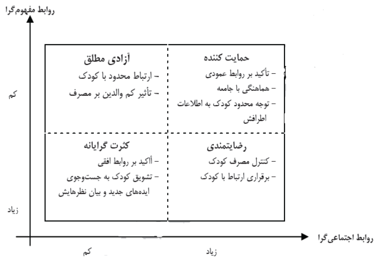
نمودار ۱. الگوهای برقراری ارتباط در خانواده (مک لود و چافی، ۱۹۷۲)

نیات رفتاری خرید. نظریه عمل منطقی ۱ (TRA) به‌طور گسترده به‌عنوان یک اساس برای پیش‌بینی نیات رفتاری و یا رفتارهایی استفاده شده است. علاوه بر این نیات رفتاری از نظریه عمل منطقی، ارائه شده توسط مهتا (۱۹۹۴)، الگویی است که نیات رفتاری (مانند علاقه به خرید و یا انگیزه های خرید) را تبیین می‌کند و در واقع متغیری مناسب برای اندازه‌گیری اثربخشی راهبردهای تبلیغاتی است (مهتا، ۱۹۹۴). علاوه بر این، زیتامل (۱۹۸۸)، پیشنهاد کرده است که متغیرهای نیات رفتاری مشتری بهترین نشانه رضایت مشتری و کیفیت خدمات کسب‌وکار است که به‌وسیله چهار آیتم توصیه به دیگران، اظهارات مثبت، تکرار خرید و مراجعه دوباره اندازه‌گیری می‌شوند (بیگنه و همکاران، ۲۰۰۵).