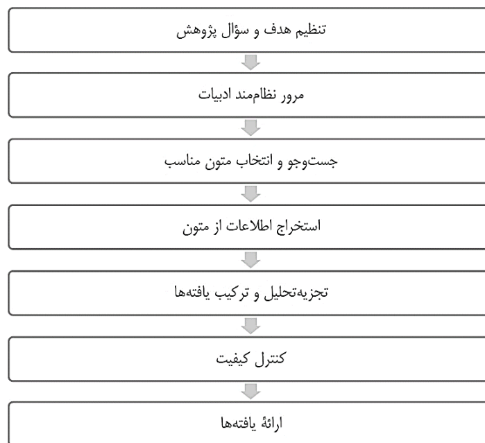
شکل ۱. مراحل روش فراترکیب (کردحیدری و همکاران، ۱۳۹۸)

و داخلی مانند نورمگز، مگیران، سیوبلیکا، مرکز پژوهشگاه علوم و فناوری اطلاعات ایران و غیره (پژوهش‌های سال‌های ۱۹۸۰ تا ۲۰۲۴ و ۱۳۹۰ تا ۱۴۰۲) و بررسی تا حد اشباع نظری و پژوهش‌های انجام شده در این حوزه است. پس از جست‌وجو و انتخاب متون مناسب اولیه از ادبیات موجود و مبتنی بر مطالعه منابع اطلاعاتی مرتبط با سوگیری‌های شناختی سیاست‌گذاران در تصمیمات استراتژیک، از طریق فرایند روش فراترکیب، به کدگذاری، مشابهت‌یابی و تلخیص متون بر اساس کلیدواژه‌های موردنظر پرداخته شد و در ادامه مورد ارزیابی و اعتباریابی قرار گرفت (Paul & Barari, 2022). بطور کلی، تجزیه و تحلیل اطلاعات در ۳ مرحله انجام شده است. در مرحله اول، با بررسی کامل ادبیات تحقیق، فهرستی از مقالات مرتبط با این حوزه و حتی مقالاتی که به‌طور مستقیم به این موضوع نپرداخته‌اند، تهیه گردید؛ در مرحله دوم، چکیده این مقالات استخراج و مقالات دسته‌بندی شدند و در مرحله سوم، با استخراج عناصر کلیدی، ترکیب نهایی انجام گردید و تحلیل و جمع‌بندی صورت گرفت (کردحیدری و همکاران، ۱۳۹۸). برای بهره‌گیری از این روش پژوهشی، روش هفت مرحله‌ای سندلوسکی و باروسو ۶ (۲۰۰۷) مورد استفاده قرار گرفت که عبارت است از: